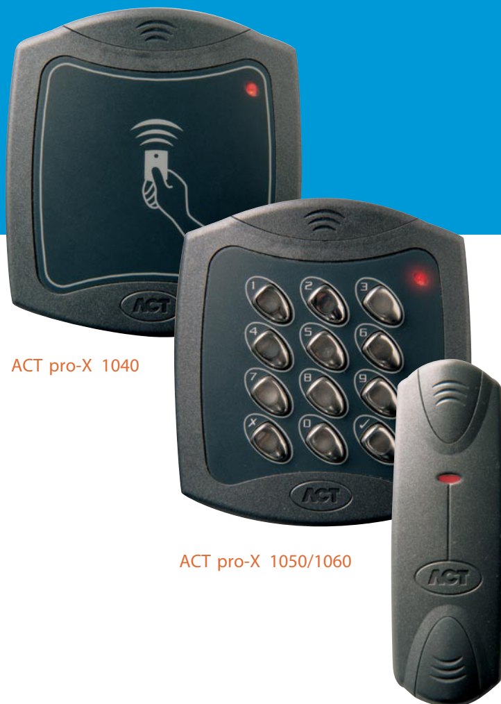
ACT pro-X 1040

Max. afstand tussen controller en lezer is 100 meter indien van +12V DC voeding is voorzien