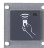
ACT pro-X 1030 PM

Inbouw en opbouw bevestigingsaccessoires beschikbaar voor ACTpro-x 1040/1050/1060 lezers